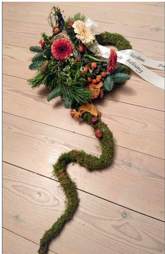
Kransene spesiallages på bestilling, slik at ingen kranser er like