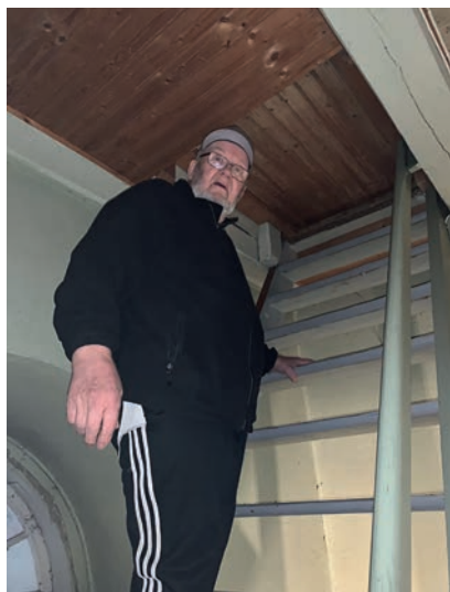
Det var bratt å komme seg opp i kirketårnene. HMS var ikke oppfunnet da jeg begynte

- Jeg har hatt stor glede av å stå å ringe jula inn mange ganger. Det minnes jeg med glede, men jeg minnes også at jeg måtte passe meg for kirkeklokkene.