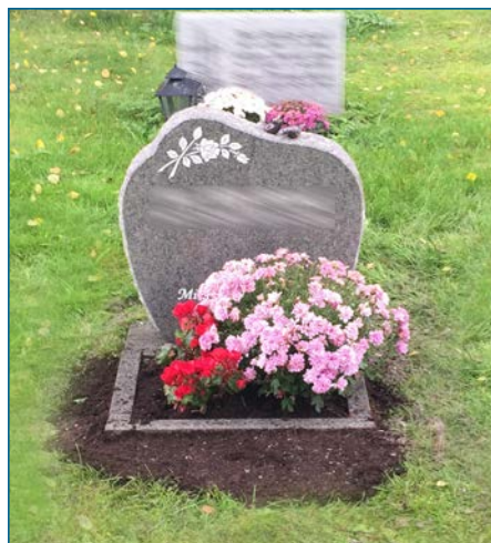
Nylig montert gravminne med omrammet plantefelt