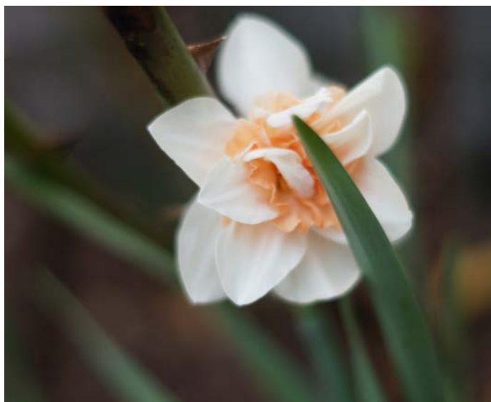
Nydelige pinseliljer