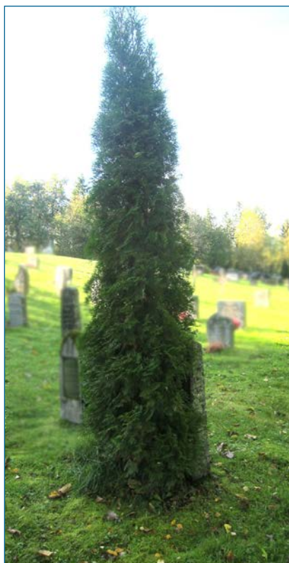
Noen ganger går det helt galt....